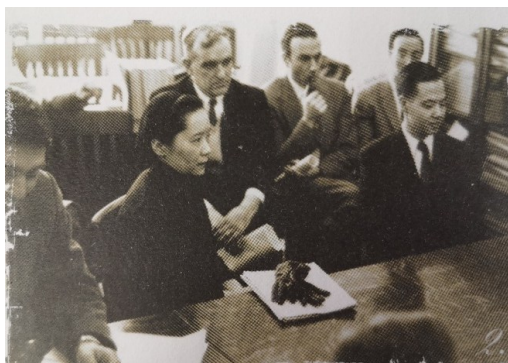
图3 1957年1月15日,哥伦比亚大学召开新闻发布会宣布推翻宇称不守恒定律,前排右起为李政道、吴健雄,后排左1为安布勒

事实上,在实验验证弱作用下宇称不守恒之前,物理学界并没有立即接受李-杨的观点,甚至有一些权威物理学家公开反对这一观点。据特莱格