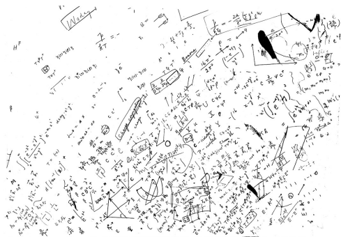
图1 1956年夏,李政道同杨振宁在布鲁克海文实验室访问时讨论所用的手写板

1956年上半年, \theta - \tau 疑难是李政道和杨振宁讨论的重点(图1)。经过几次富有成效的讨论和查阅大量文献,二人发现,尽管在核物理和 \beta 衰变中已广泛应用宇称守恒的先验性的假定,但在弱相互作用中并不存在宇称守恒的任何证据。为此,他们在不预设弱作用下宇称守恒的情况下,各自独立地重新严格推导和计算与弱作用相关的物理过程,并提出强有力的论据,说明违反这一定律的可能性。同时,他们提出一些关于 \beta 衰变以及超子和介子衰变的实验,为检验宇称是否守恒提供必要的证据 12 。